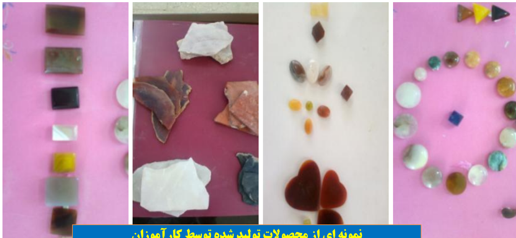
نمونه ای از محصولات تولید شده توسط کارآموزان

کارآموزان با مهارتی که در این دوره بدست می آورند اقدام به ایجاد کسب و کار برای خود می نمایند و سنگ های تراش داده شده و آماده شده را به شرکت تعاونی می فروشند. دهیاری در این مرحله از فروش سنگ های مذکور ماهیانه مبلغی در حدود ۶/۰۰۰/۰۰۰ ریال درآمد خواهد داشت.