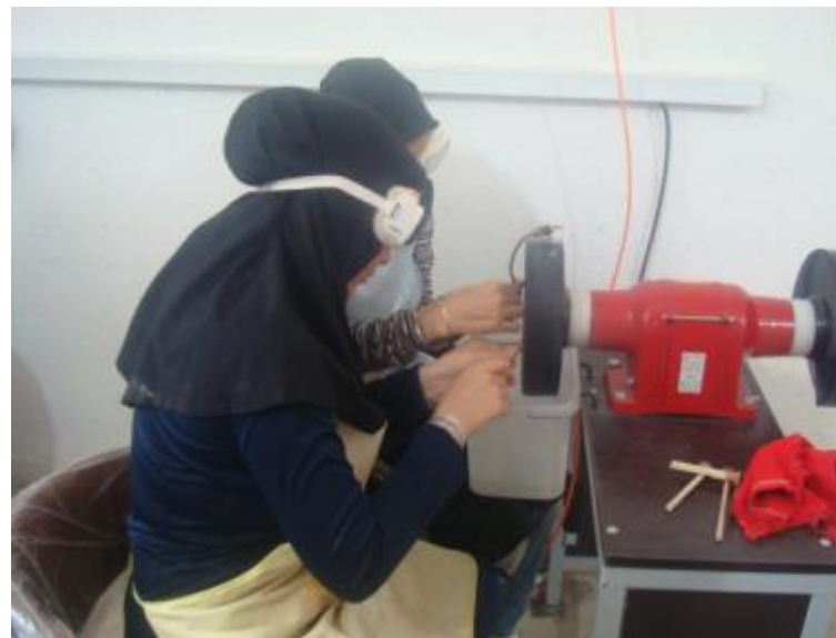
کارآموزان در حال کار در کارگاه

هر کارآموزي که دوره آموزشي را با موفقيت سپري نمايد طي هماهنگي با پست بانک مبلغ ۲۵/۰۰۰/۰۰۰ ريال وام اشتغال زايي در يافت مي نمايد.